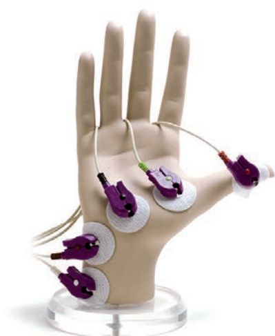
Elektromiografia (EMG) Wymaga 5 elektrod.

Żywotność czujnika mechanizmu w kontekście przeciętnego użytkowania wynosi 2 lata. Pamiętaj, aby je wymieniać, aby zagwarantować jakość pomiarów.