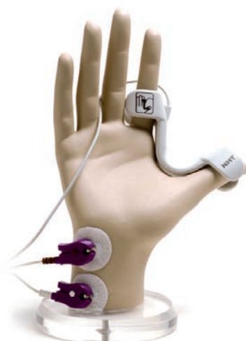
Kinemiografia (KMG) Wymaga 2 elektrod